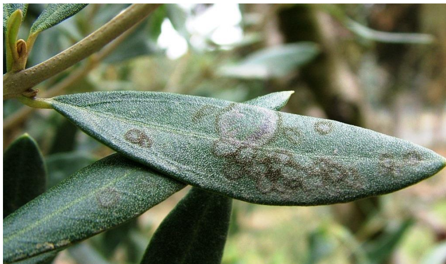
Κυκλικές κηλίδες στην πάνω επιφάνεια των φύλλων