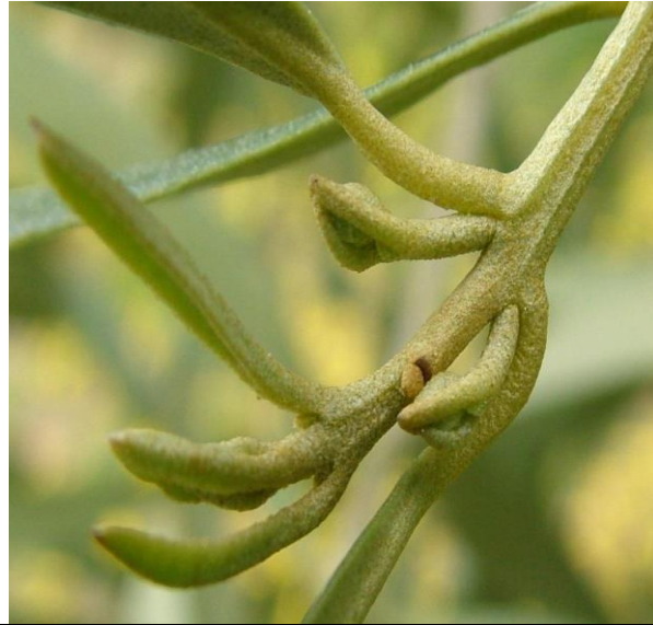
Μήκος νέας βλάστησης 2 - 5 εκατοστά