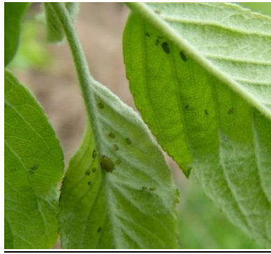
περίπου 15 άτομα πράσινης αφίδας