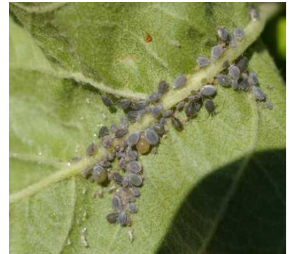
Dysaphis plantaginea ρόδινη αφίδα μηλιάς