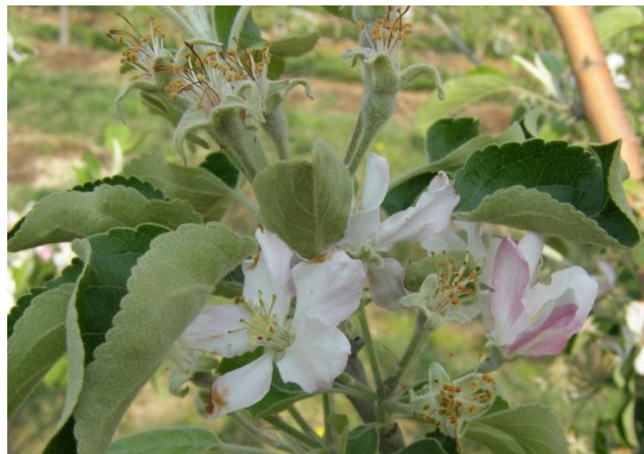
70–90% πτώσης πετάλων