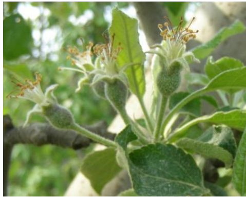
Η πλήρης πτώση πετάλων