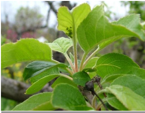
αφίδες στην κάτω επιφάνεια φύλλου