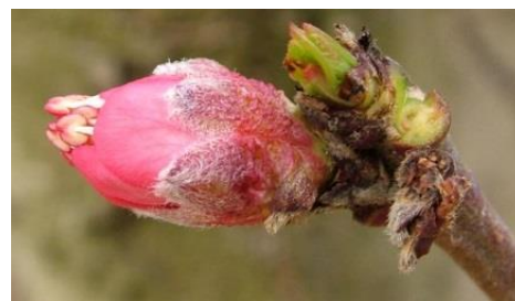
E Εμφάνιση στημόνων