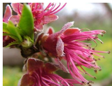
G Πτώση πετάλων