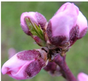
D Εμφάνιση στεφάνης