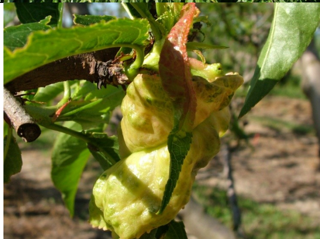
Προσβολή από εξώασκο