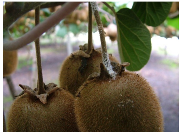
Προσβολή από βαμβακάδα σε Ροδακινιά και Ακτινιδιά