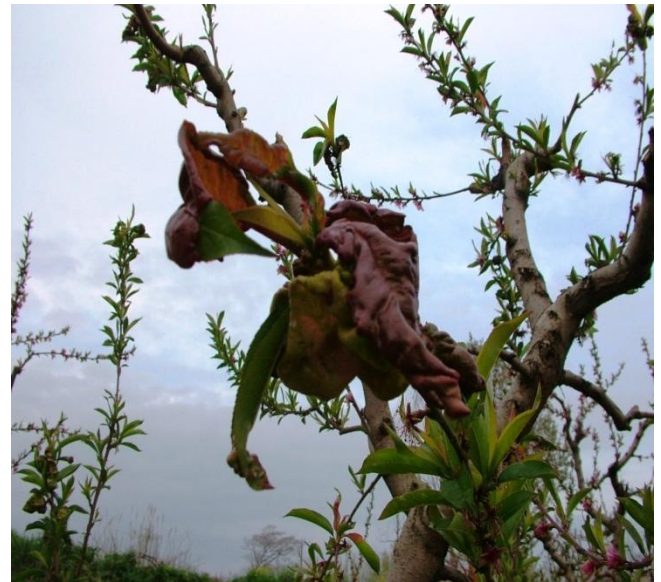
Εξώασκος – Καρούλιασμα φύλλου