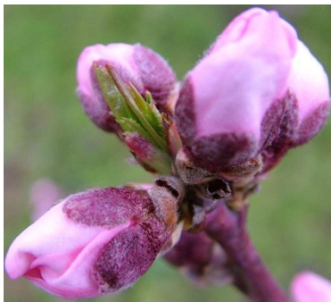
D Εμφάνιση στεφάνης