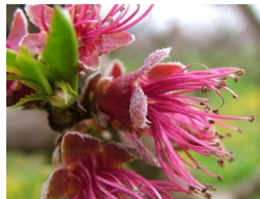
G Πτώση πετάλων