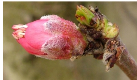
E Εμφάνιση στημόνων