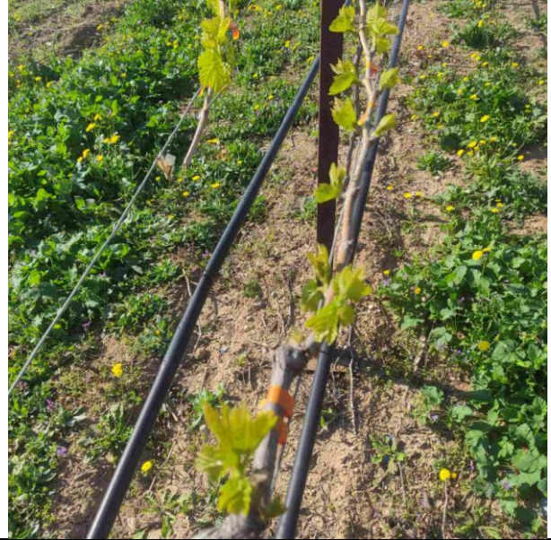
Πρώιμες ποικιλίες (21-3-2025)