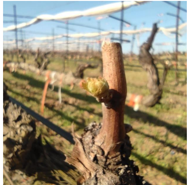
Όψιμες ποικιλίες (21-3-2025)