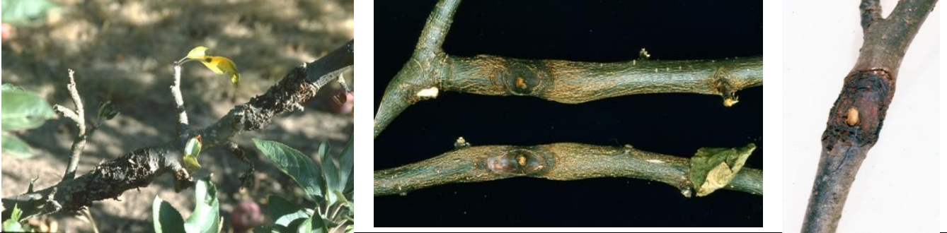
προσβολή Μηλιάς από Nectria galligena