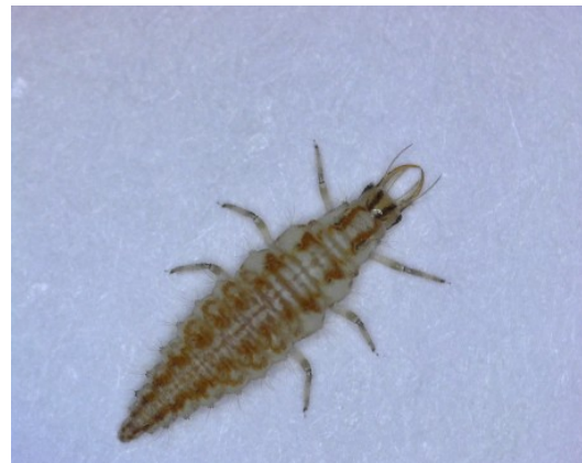
Προνύμφη του γένους Chrysoperla