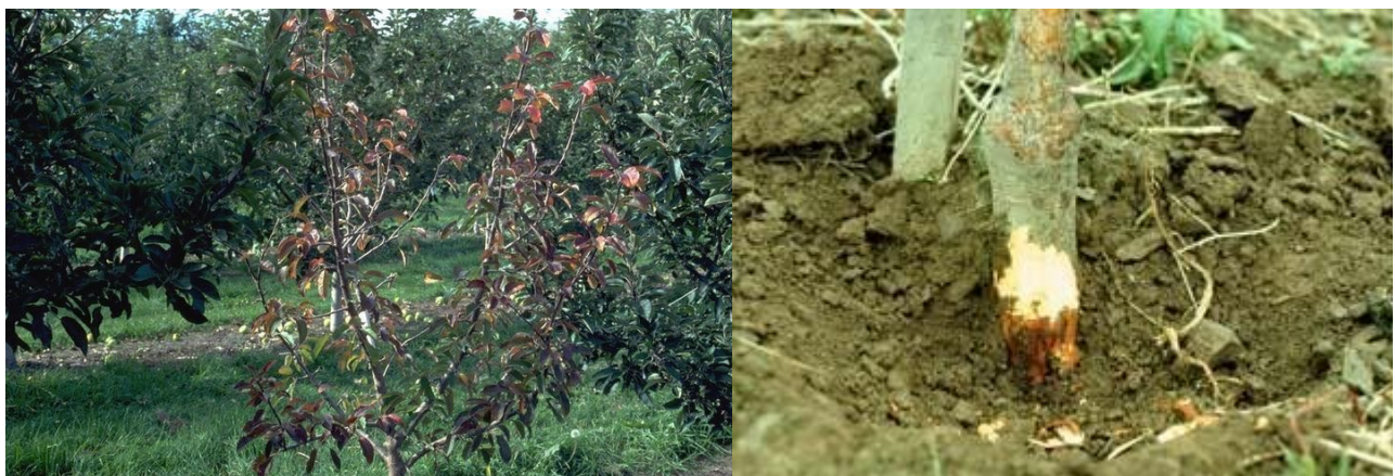
προσβολή Μηλιάς από Phytophthora