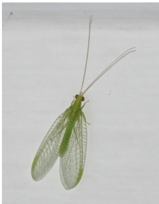
Ενήλικο του γένους Chrysoperla (Οικ.: Chrysopidae )