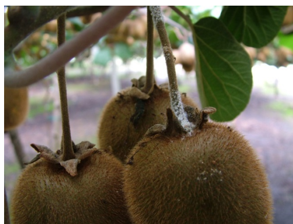
Προσβολή από βαμβακάδα σε Ροδακινιά και Ακτινιδιά