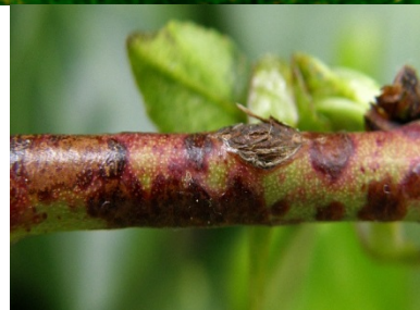
Προσβολή από κορύνεο