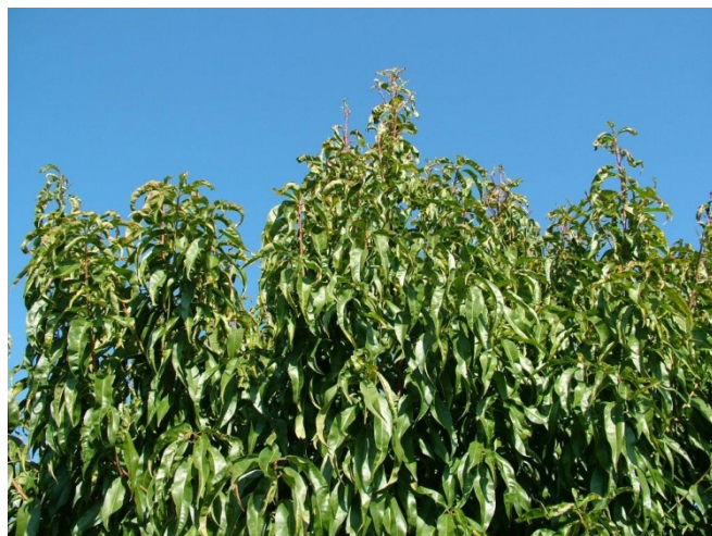
Προσβολή από εξώασκο