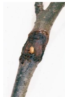
προσβολή Μηλιάς από Nectria galligena