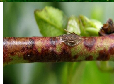
Προσβολή από κορύνεο