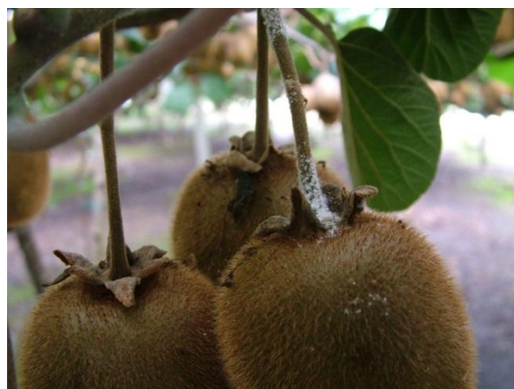
Προσβολή από βαμβακάδα σε Ροδακινιά και Ακτινιδιά