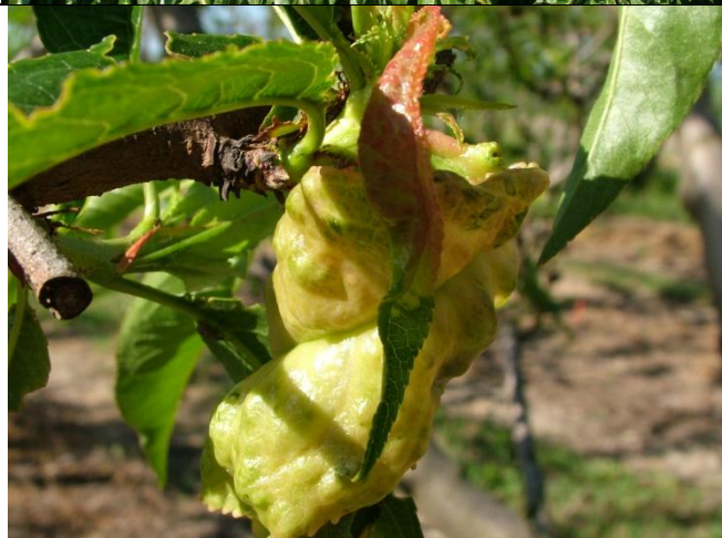
Προσβολή από εξώασκο