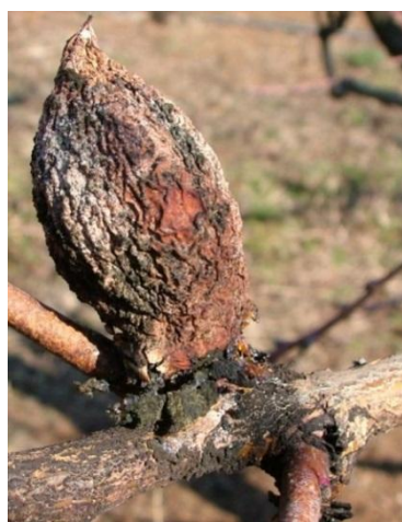
Προσβολή από Μονίλια