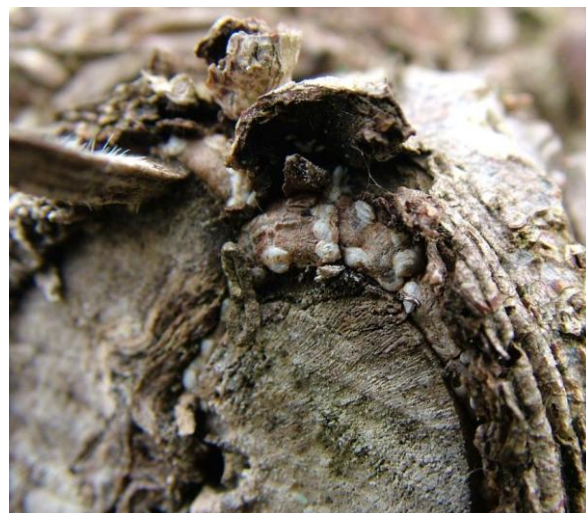
Προσβολή ακτινιδιάς από βαμβακάδα