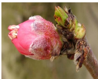
E Εμφάνιση στημόνων