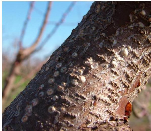
Παρουσία ασπιδίων βαμβακάδας στο 25%