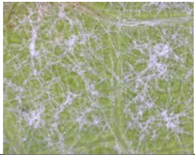
Επάνθιση (καρποφορία του μύκητα) στην κάτω επιφάνεια του φύλλου