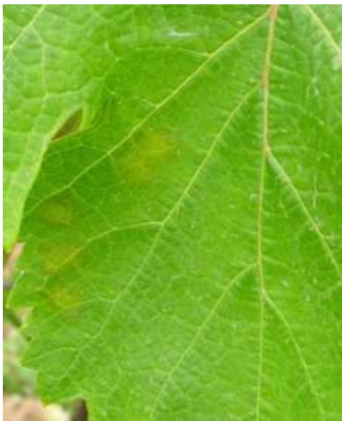
Κηλίδες λαδιού στην πάνω επιφάνεια του φύλλου

Η επέμβαση κρίνεται απαραίτητη εάν διαπιστωθεί η πρώτη ένδειξη συμπτωμάτων, δηλαδή κηλίδες λαδιού ή επάνθιση.