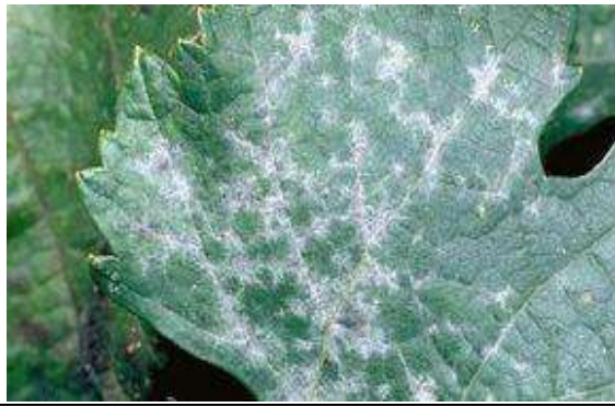
Μέτρια (εμφανείς αρκετές κηλίδες προσβολής, συνήθως περιορισμένες σε διάμετρο 2-5 εκατ)