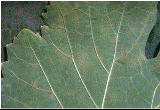
Ίχνη (ελάχιστες κηλίδες προσβολής ή κανένα σύμπτωμα, ούτε μυκήλιο ούτε ορατή καρποφορία του μύκητα, μόνο ένα μικρό κατσάρωμα του ελάσματος)