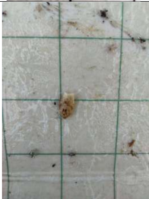
Φυλλοδέτης - Adoxophyes orana Fischer von Rosslerstamm