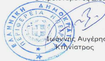
Ιωάννης Αυγέρης Κτηνίατρος