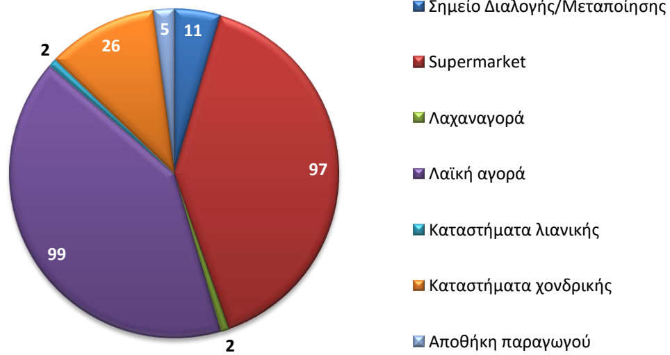
Διάγραμμα 2. Κατανομή των σημείων δειγματοληψίας που αφορά τους ελέγχους της εσωτερικής αγοράς για το μήνα Μάιο 2024.