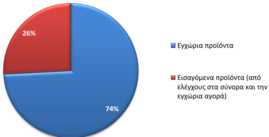
Διάγραμμα 3. Ποσοστιαία αναλογία (%) εγχώριων και εισαγόμενων προϊόντων, στα οποία έγιναν δειγματοληψίες το μήνα Μάιο 2024, για την ανίχνευση υπολειμμάτων φυτοπροστατευτικών προϊόντων.